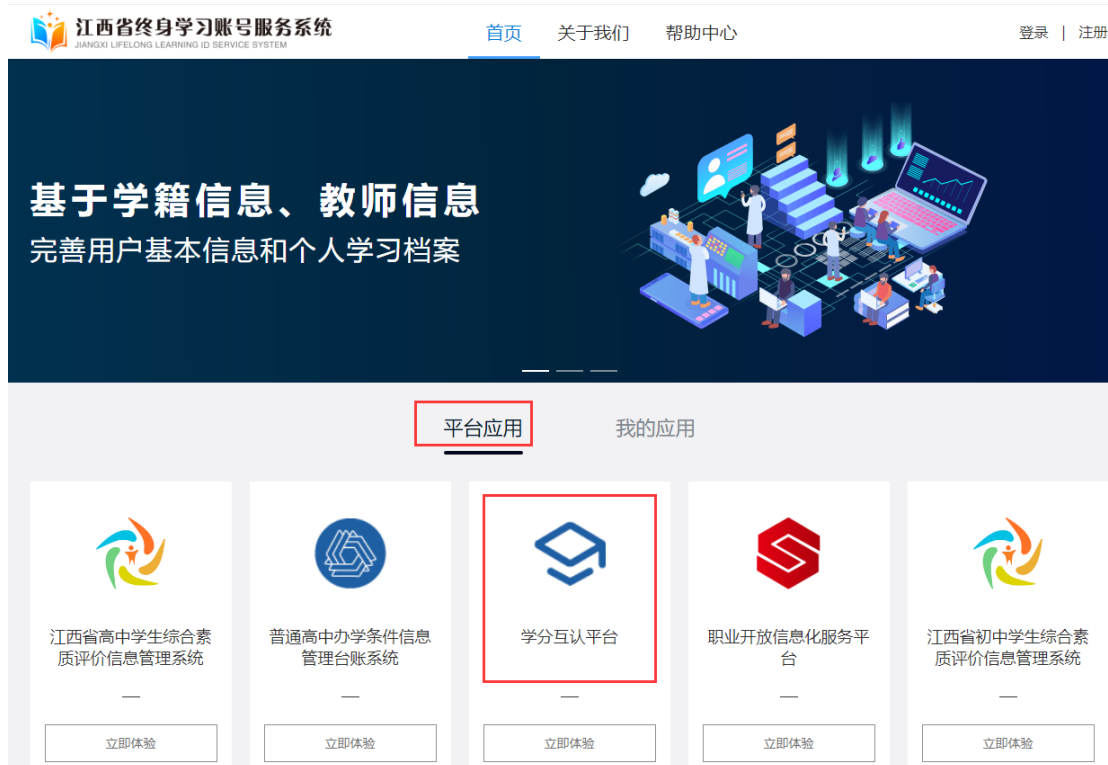
图1-2 终身学习账号服务系统登录后的界面