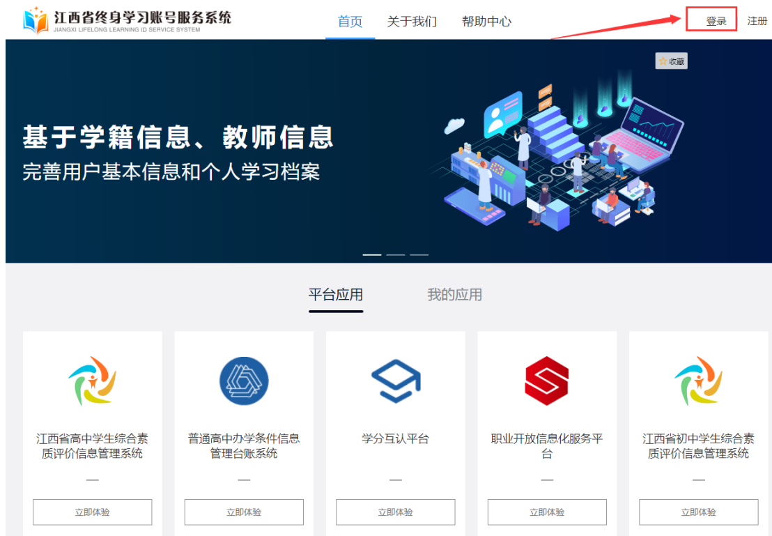
图1-1 终身学习账号服务系统界面

打开教育厅主页： http://11a.jxedu.gov.cn/ ；进入“江西省教育终身学习账号服务系统”，如图 1-2。